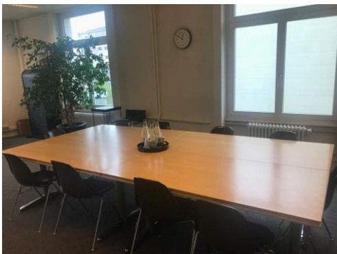
Heller, freundlicher Sitzungsraum für bis zu 12 Personen